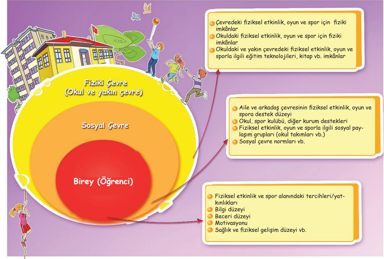
Şekil 2. Okula özgü düzenlemelerde incelenmesi gereken temel unsurlar

Bu Program'daki kazanımlara ulaşmak için öğretmenler, öğrencilerin bireysel özellikleri ile sosyal ve fiziksel çevrelerinin özellikleri doğrultusunda uyarlamalar yapmalıdırlar. Örneğin öğretmenler etkinlik seçimi ve uygulamalarında okul çevresinin sosyal, kültürel durumu, veli beklentileri ve hassasiyetlerini gözden geçirerek modern danslar yerine halk danslarına yer verebilirler. Bu amaçla eğitim öğretim yılı başında öğretmenlerin Şekil 2'de belirtilen her bir boyutu gözden geçirerek düzenlemeler yapmaları önerilir.